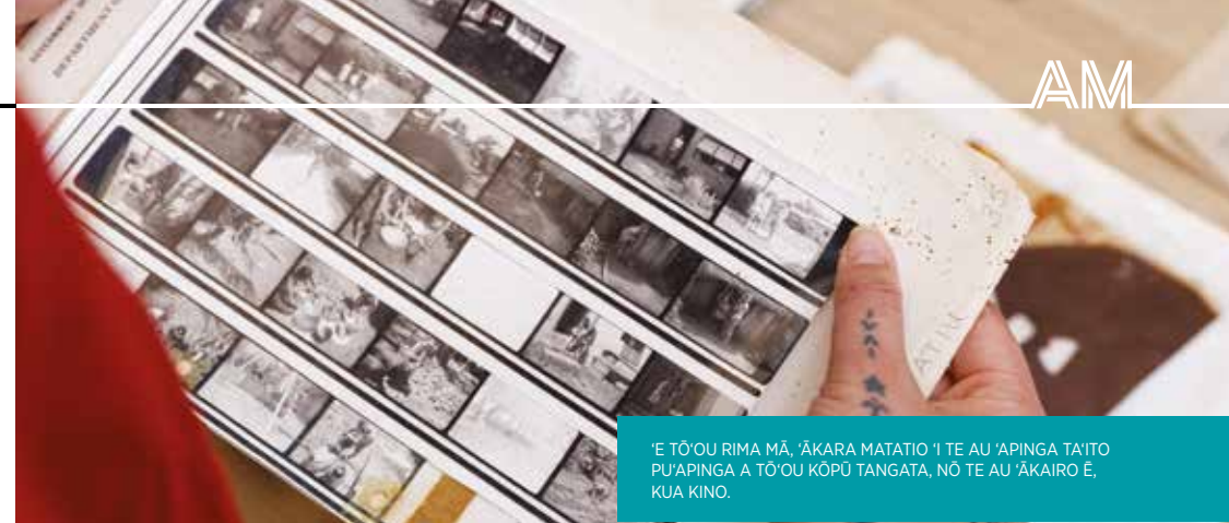
‘E TŌ’OU RIMA MĀ, ‘ĀKARA MATATIO ‘I TE AU ‘ĀPINGA TA’ITO PU’ĀPINGA A TŌ’OU KŌPŪ TANGATA, NŌ TE AU ‘ĀKAIRO ‘E, KUA KINO.

‘Ea’ā tē kā rauka iā koe ‘i te rave: Kā rori te vai’o’anga ‘i te au putunga ‘āpinga ki roto ‘i tēta’i au pi’a ‘ē vā ra mē kore kāparāta mātūtū, tano ‘ua te vāito ‘ō te reva, ‘ē te vāito vai, ‘ei ‘akaiti mai ‘i te tākinokino ‘i teia au ‘āpinga. Meitaki atu te anuanu, ko te mea pu’āpinga, kia vai anuanu ‘ua rāi tē reira. Kape ‘i te au ngā’i ka tauiu’i ‘ua te tūranga vāito reva ‘ē te vāito vai, mei te ta’ua o te ‘are ‘i raro rava, te au ‘are pā’i, au pi’a tunu kai, te au pi’a ‘i roto ‘i te tā’u’u o te ‘are, ‘ē te au kārāti. ‘Akaātea ‘i te au putunga ‘āpinga mei runga mai ‘i te ta’ua, ‘akamamao mei kō mai ‘i te au ‘āpinga ‘akavera, au paipa ‘ē te au pūruru o va’o. Tā’anga’anga ‘i te matini ngote ‘i te vāito vai ‘i roto ‘i te reva (‘ē te māramarama kua tōpiri’ia), mē kore ‘e vā’i ‘i te au māramarama, ma te tā’anga’anga ‘i te tā’iri’iri pāōa ‘ei ‘akama’ata atu ‘i te tere’anga ‘ō te reva. Ko te au ‘āpinga ngote vai ‘i roto ‘i te au pi’a vairanga ‘āpinga