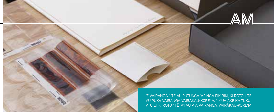
'E VAIRANGA 'I TE AU PUTUNGA 'APINGA RIKIRIKI, KI ROTO 'I TE AU PUKA VAIRANGA VAIRĀKAU-KORE'IA, 'I MUA AKE KĀ TUKU ATU EI, KI ROTO 'TĒTA'I AU PI'A VAIRANGA, VAIRĀKAU-KORE'IA

'aunga mē kore emi'anga 'ō te rīpena teata, 'e mea pu'apinga kia vairanga takakē'ia rātou 'ei pāruru 'i te tākinokino'anga 'ā te au vairākau tākinokino 'i tēta'i atu au putunga 'apinga ā'au. Mē kua 'irinaki koe ē, 'e rīpena vairākau tākinokino nitrate tā'au, mē kore 'akakino'anga vairākau tākinokino tēta'i, 'e kimi atu 'i te tauturu nō te kite'anga 'ē te 'a'ao'anga vairanga meitaki.