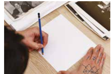
RĒKŌTI 'I TE AU TUATUA PU'APINGA ('ĀKARA'ANGA: AU INGOA, AU NGĀ'I, AU RĀ) KI MURI 'I TE AU TŪTŪ, 'Ē TE AU MEA RĒKŌTI'ANGA, MĒ KORE RA, TĀTĀ'ANGA TUATUA, NŌ TE AU UKI KI MUA.

Ka rauka iā koe te tā'anga'anga 'i tē reira, 'inārā, 'e 'āriki 'ia rātou ki te peapa kua kā'iro'ia ki te vairākau pāroru mē te tauī 'i tē reira 'i roto 'i tēta'i ngā mata'iti.