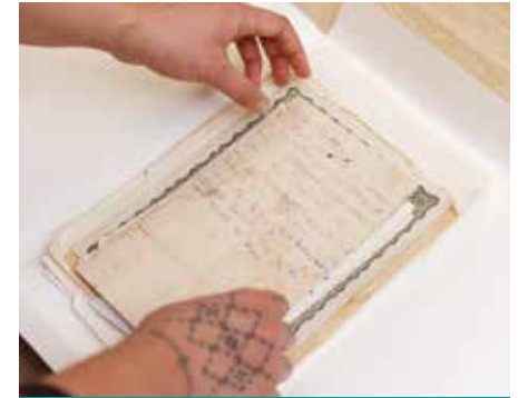
'AKAPĀPŪ MA TE VAIRANGA 'I TE AU 'APINGA 'ĀITEITE TE TŪ, KI TE NGĀ'I 'OKOTA'I.