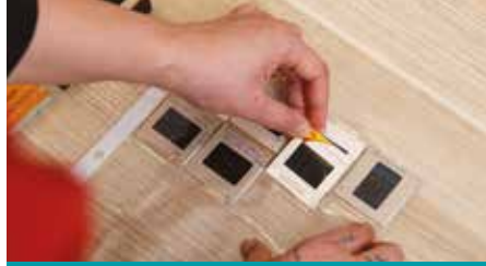
MOU MEITAKI 'I TE AU SLIDES 'Ē TE NEGATIVES, NĀ TE 'ITI.