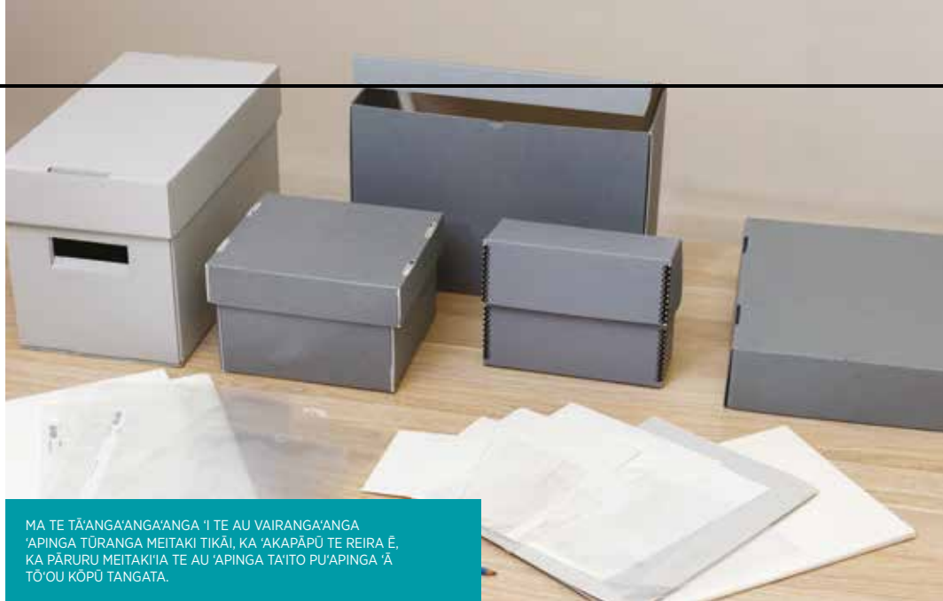
MA TE TĀ'ANGA'ANGA'ANGA 'I TE AU VAIRANGA'ANGA 'APINGA TŪRANGA MEITAKI TĪKAI, KA 'AKAPĀPŪ TE REIRA Ē, KA PĀRURŪ MEITAKI'IA TE AU 'APINGA TA'ITO PU'APINGA 'Ā TŌ'OU KŌPŪ TANGATA.