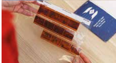
KA RAUKA 'I TE AU VAIRANGA 'APINGA UNA, 'I TE PĀRURU 'I TE AU SLIDES, 'Ē TE AU NEGATIVES.