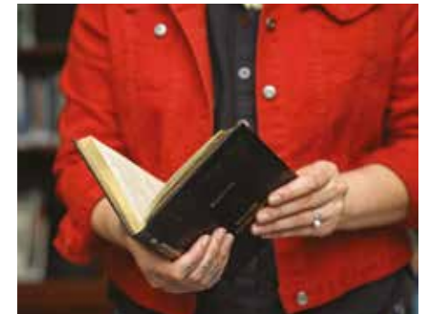
TATALA NA TUHI KUA MUKAMUKA KE TĀTIA I TE 90°- 120° TIKELI