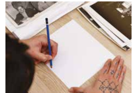
TUHI KI LALO NA FAKAMATALAGA TĀUA (E VEIA KO NA IGOA, NA KOGA, NA AHO) KI TUA O NA ATA MA NA PEPA KE MATEA GOFIE AI.