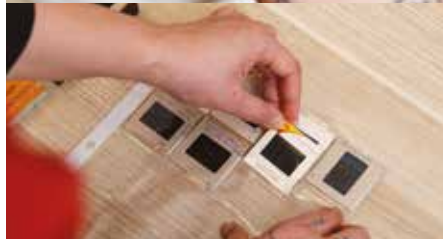
TAOFI FAKALELEI I NA PITO NA TAMĀ ATA MA NA PEPA ONA ATA PUKE E HEKI LOLOMIA (NEGATIVES)