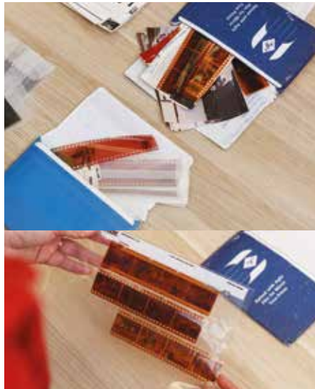
KO NA PEPA E IEI AI NA TAGA E MAFAI KE TEU AI NA TAMĀ ATA MA NA PEPA O NA ATA PUKE E HEKI LOLOMIA (NEGATIVES).