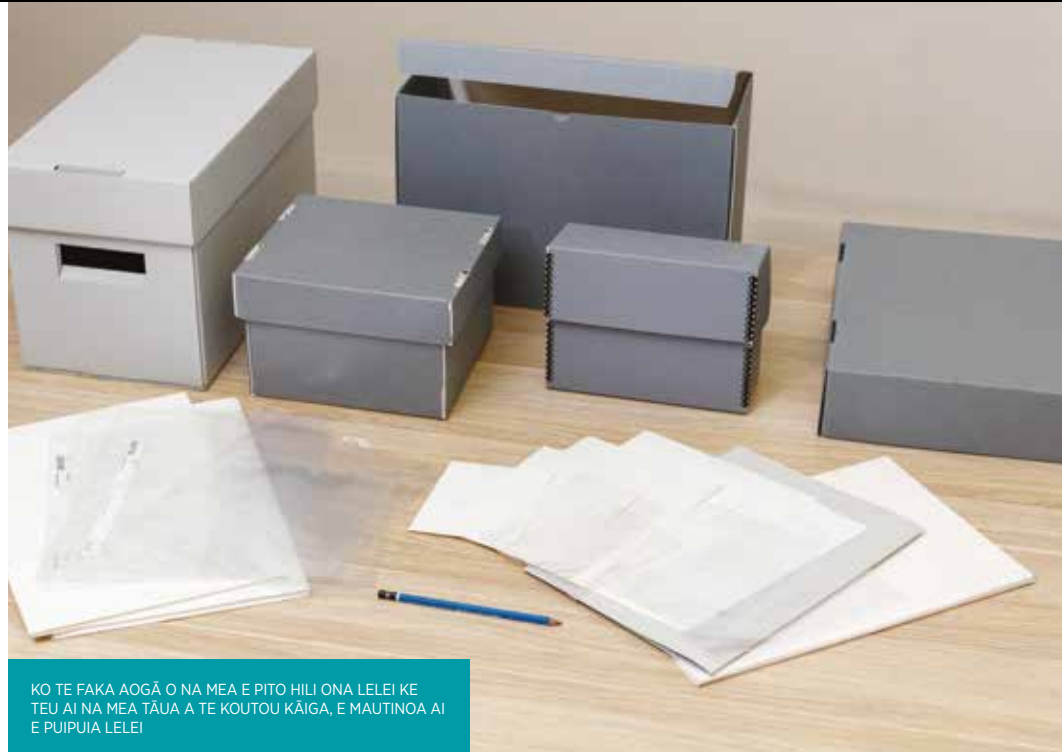
KO TE FAKA AOGĀ O NA MEA E PITO HILI ONA LELEI KE TEU AI NA MEA TĀUA A TE KOUTOU KĀIGA, E MAUTINOĀ AI E PUIPUIA LELEI