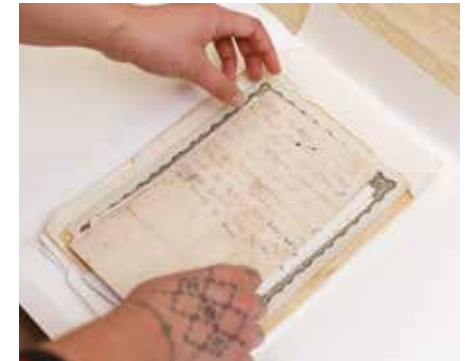
TEU MA TUKU FAKATAHI NA MEA E TUTUHA