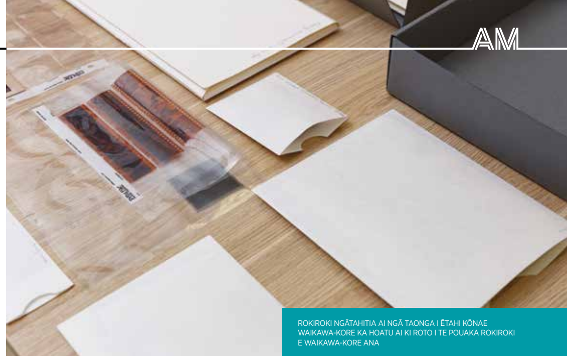
ROKIROKI NGĀTAHITIA AI NGĀ TAONGA I ĒTAHI KŌNAE WAIKAWA-KORE KA HOATU AI KI ROTO I TE POUAKA ROKIROKI E WAIKAWA-KORE ANA

Ki te rongo koe i tētahi haunga, ki te kaurikiriki haere rānei te kiri tōruna, he mea nui kia rokirokihia ēnei taonga ki wāhi kē, kia kore ngā waikawa kino e whakakino i te katoa o ō taonga. Mēnā e whakaaro ana koe, he kiri pākawa ota āu, e heke haere ana rānei te kounga o tō kiri pākawa ota, me tono āwhina kia āta tautuhia, kia āta tiakina tō momo kiriata.