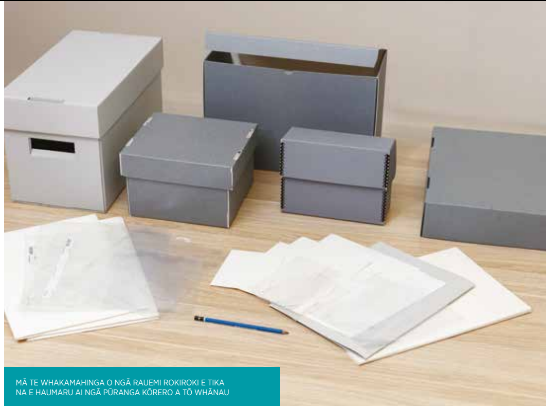
MĀ TE WHAKAMAHINGA O NGĀ RAUEMI ROKIROKI E TIKA NA E HAUMARU AI NGĀ PŪRANGA KŌRERO A TŌ WHĀNAU