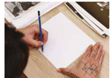
E ORA TONU AI ŌNA KŌRERO, ME TUHI I ŌNA TAIPITOPI TOHUHAKE (PĒNEI I TE INGOA, TE WĀHI, TE RĀ) I TE ANGAMATE O NGĀ WHAKAAHUA ME NGĀ PUKA