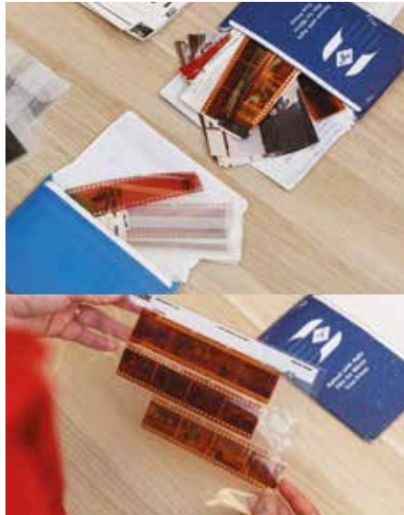
MĀ NGĀ KŌPĀKI KIRIHOU NGĀ KIRIATA ME NGĀ TŌRARO E ROKIROKI.