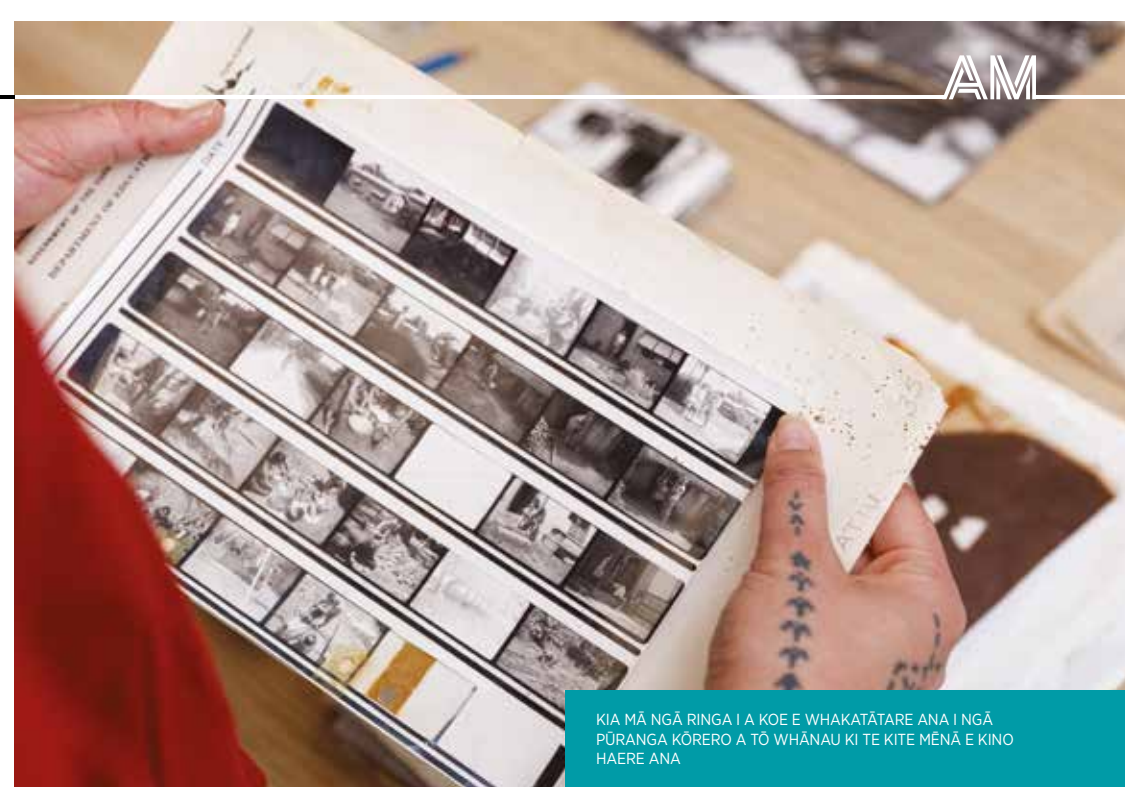
KIA MĀ NGĀ RINGA I A KOE E WHAKATĀTARE ANA I NGĀ PŪRANGA KŌRERO A TŌ WHĀNAU KI TE KITE MĒNĀ E KINO HAERE ANA

Me pēhea te whakatikatika: Kia rite tonu te tiroiro i tō kohinga taonga, kei tūpono pā te puehu me te pūhekaheka. Tahitahia te paruparu, te puehu hoki